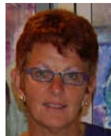
Nel v. Klaveren