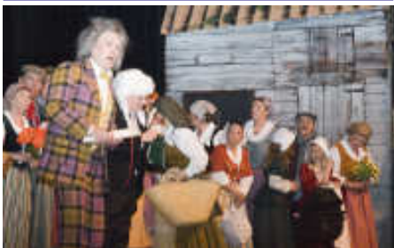
Geslaagde uitvoeringen van Blauwbaard