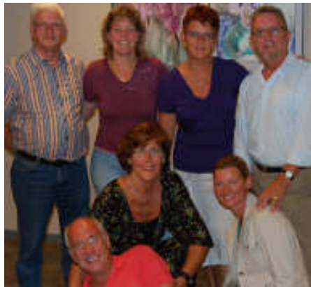
Bestuur weer op volle sterkte