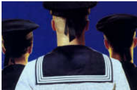
De Jantjes, 2009 Het Vikingschip Den Oever