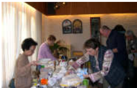
Rommelmarkt op 25 oktober