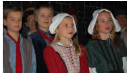
De jeugd bij Blauwbaard