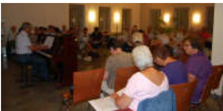
Repetities in de Meerbaak